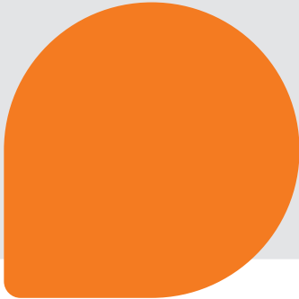
Figure 1: Magic Quadrant for Unified Communications as a Service, Worldwide